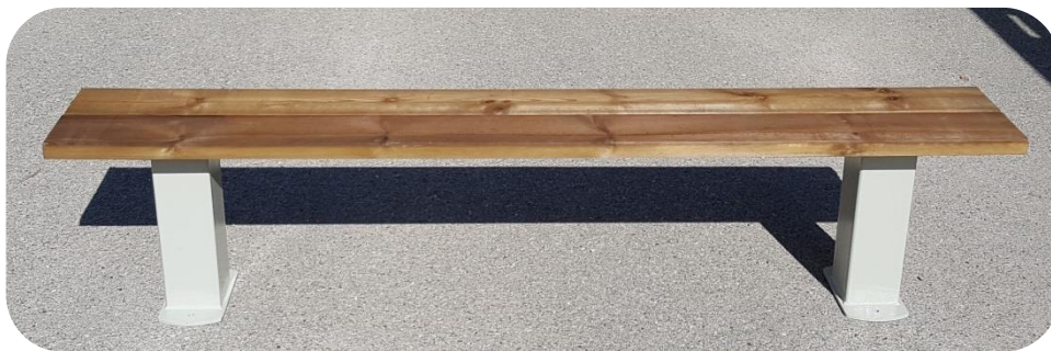
Planche en 45 / 145 / 2000 mm